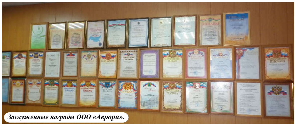
Заслуженные награды ООО «Аврора».

P.S. 22 июля в ООО «Аврора» пробный выезд в поле сделал зерноуборочный комбайн. Вот и жатва пришла.